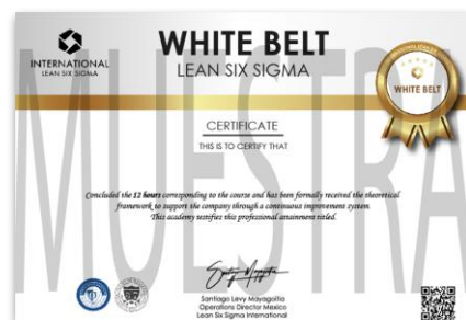
Ejemplo de certificado