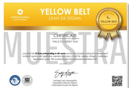
Ejemplo de certificado