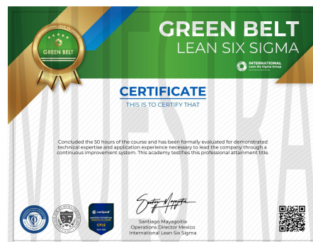
Ejemplo de certificado